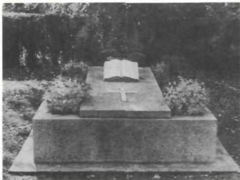
Verseghy sírja a szolnoki temetőben

VERSEGHY FERENC 1757. ÁPRILIS 3-ÁN SZÜLETETT SZOLNO- KON. A MAGYAR JAKOBINUS MOZGALOM TEVÉKENY RÉSZT- VEVŐJE, KÖLTŐ ÉS REGÉNYÍRÓ, FORDÍTÓ ÉS NYELVTUDÓS, MUZSIKUS ÉS FILOZÓFUS. SZÜLŐVÁROSA AZÓTA IS SZÁMON- TARTJA NAGY FIÁT, SOKAT TETT MUNKÁSSÁGÁNAK NÉP- SZERŰSÍTÉSÉÉRT, SZOBROT ÁLLÍTOTT NEKI A TISZA-PAR- TON, HAZAHOZOTT HAMVAIT DÍZSÍRHELYEN TEMETTETTE EL, RÓLA NEVEZTE EL LEGRÉGIBB GIMNÁZIUMÁT ÉS A ME- GYEI KÖNYVTÁRAT, S UTCANÉV IS ÓRZI EMLÉKÉT.