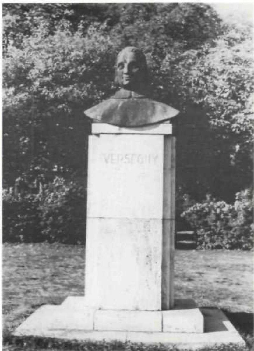
Versegyi mellszobor a Tisza-parton. Borberekí Kováts Lajos alkotása