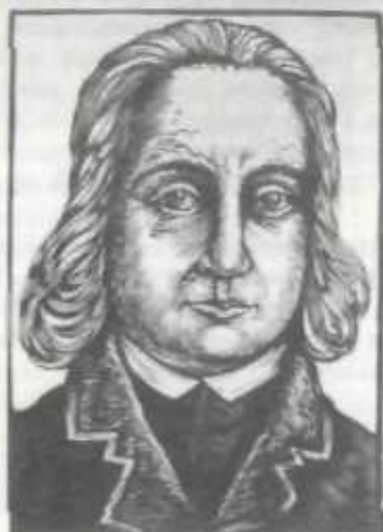
IN MEMORIAM VERSEGHY FERENC