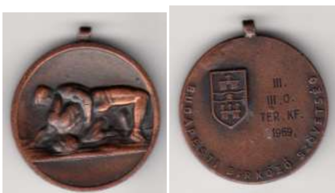
Kör alakú bronzérem, elején dombornyomott birkózók. Hátoldalán Körben felirat Budapesti birkózó Szövetség III.III. O. TER. KF. 1969. baloldalon egy címer. Átmérő 40mm súly 27g