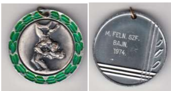
Kör alakú ezüstérem az elején körbe zöld színű levelek vannak belül egy dombornyomott mellkép, aki a kezében tart egy ágat. Hátoldalán jobb oldalt 3 függőleges csík, alul 3 vízszintes csík amik keresztezik egymást., sima részen szöveg: M. Feln. Szf. Bajn. 1974. Felül van benne egy lyuk, amiben karika van. Méret 41mm súly 11g