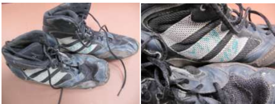
Fekete Adidas birkózó cipő, teteje bőr, textil, talpa gumi. Bal cipő belső oldalán zöld dedikációval. Sike Andrásé 1988 Szöul. Cipő hossza 28cm-