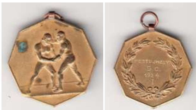
Nyolcszögű aranyérem. Elején két birkózóval. Hátoldalán babérkoszorúban szöveg Pestujhelyi s.c.1924.I. Átmérő 36mm súly 17g.