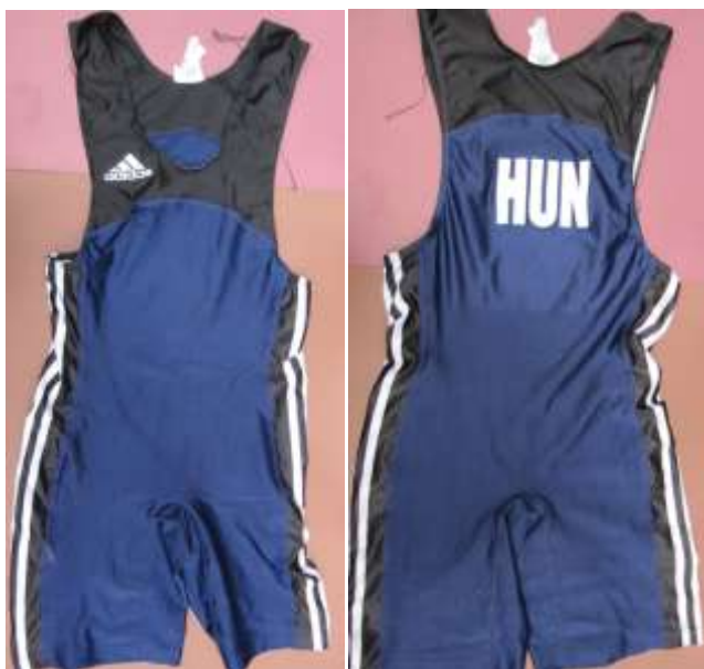
Majoros István olimpiai bajnok dressze. Adidas márkájú hátán HUN felirat, sötétkék, fekete-fehér csíkokkal. Mérete 44 Anyaga 84% poliészter, 16% elasztán.