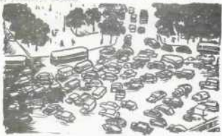
A gépjárműközlekedés fejlődése, forgalomterhelés előtt

A modern város biológiai es- közössége. /A10, P77, 2-3004/